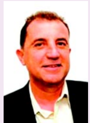
*Por Ruben Elias, Director Delegado de CEDOL