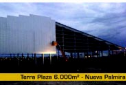
Terra Plaza 6.000m 2 - Nueva Palmira