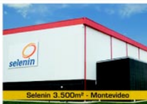
Selenin 3.500m 2 - Montevideo