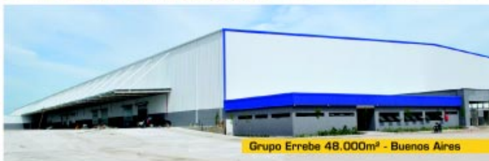
Grupo Errebe 48.000m 2 - Buenos Aires

ESTRUCTURAS METÁLICAS - PISOS INDUSTRIALES