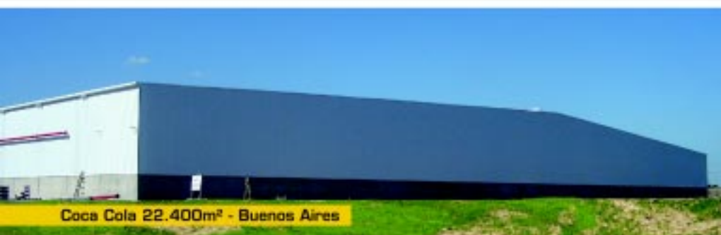
Coca Cola 22.400m 2 - Buenos Aires