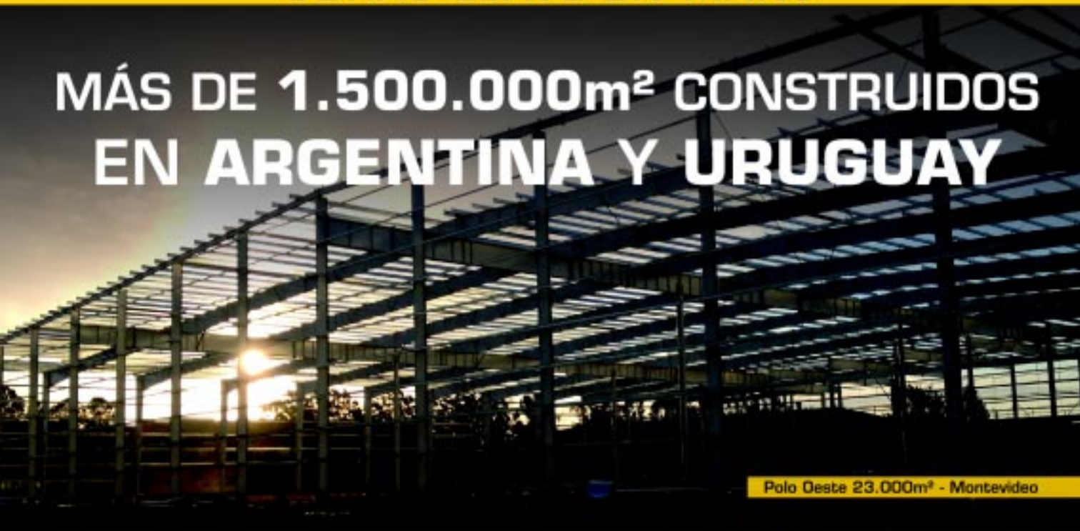
Polo Oeste 23.000m 2 - Montevideo

MÁS DE 1.500.000m 2 CONSTRUIDOS EN ARGENTINA Y URUGUAY